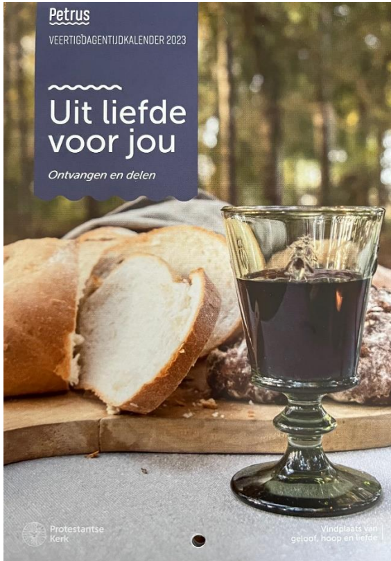
Uit de 40-dagen kalender

E-mail: samengaan.dierenspankeren@gmail.com